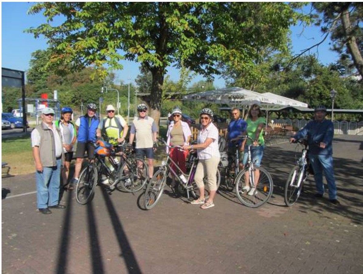
Gleich geht's los