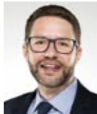
Landrat Thorsten Stolz