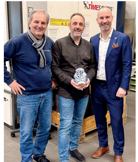
Von der klassischen Schlosserei zum Spezialisten für Laserschneiden: Die K. & M. Stier GbR ist Spezialist für Metallverarbeitung mit Laser- und Kantentechnik und beschäftigt 24 Mitarbeiter.

Das Unternehmen mit Sitz im Gewerbegebiet am Lindenbäumchen Heldenbergen profitiert von einer exzellenten Infrastruktur. „Wir schätzen die gute Verkehrsanbindung und das schnelle Internet mit Megabit-Leitung. Diese Vorteile