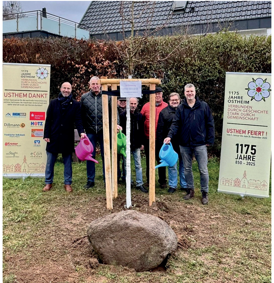
Baum der Zukunft: Der Burgenahorn wird bis zum nächsten Jubiläum schon ein kleiner Riese sein.