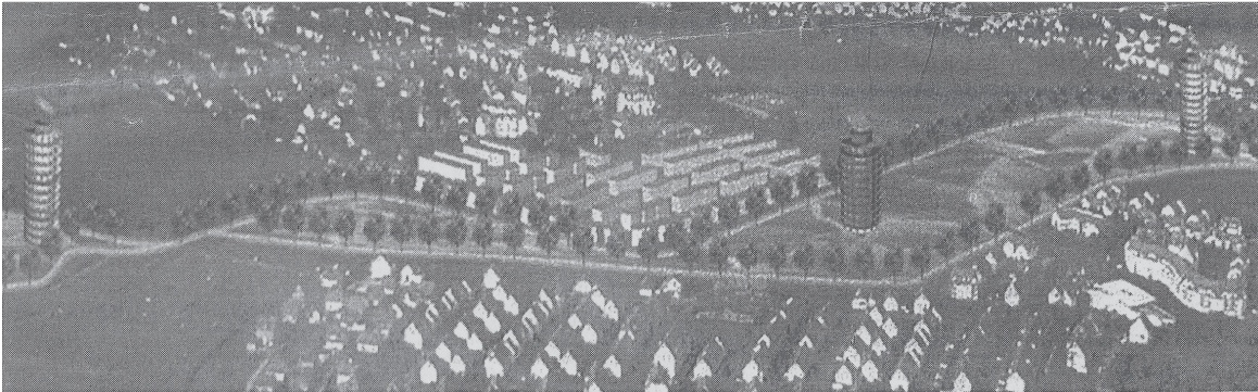
Am Computer verwirklichte Utopie: Wohn- und Arbeitstürme ziehen sich in einem kilometerlangen Grünstreifen durch Heldenbergen. Ein Vorschlag, der erwartungsgemäß auf wenig Zustimmung bei der Jury stieß.