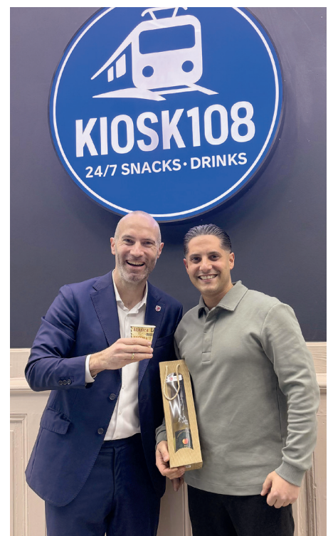
Kaffee und mehr - nicht nur für Nachtschwärmer: Der Kiosk 108 bietet im Bahnhof Heldenbergen ein kleines Sortiment an.