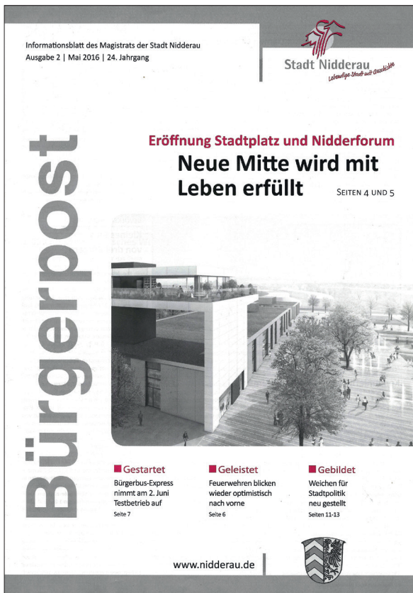
Realität 2016: Sky Lounge als neues Zentrum der Neuen Mitte.