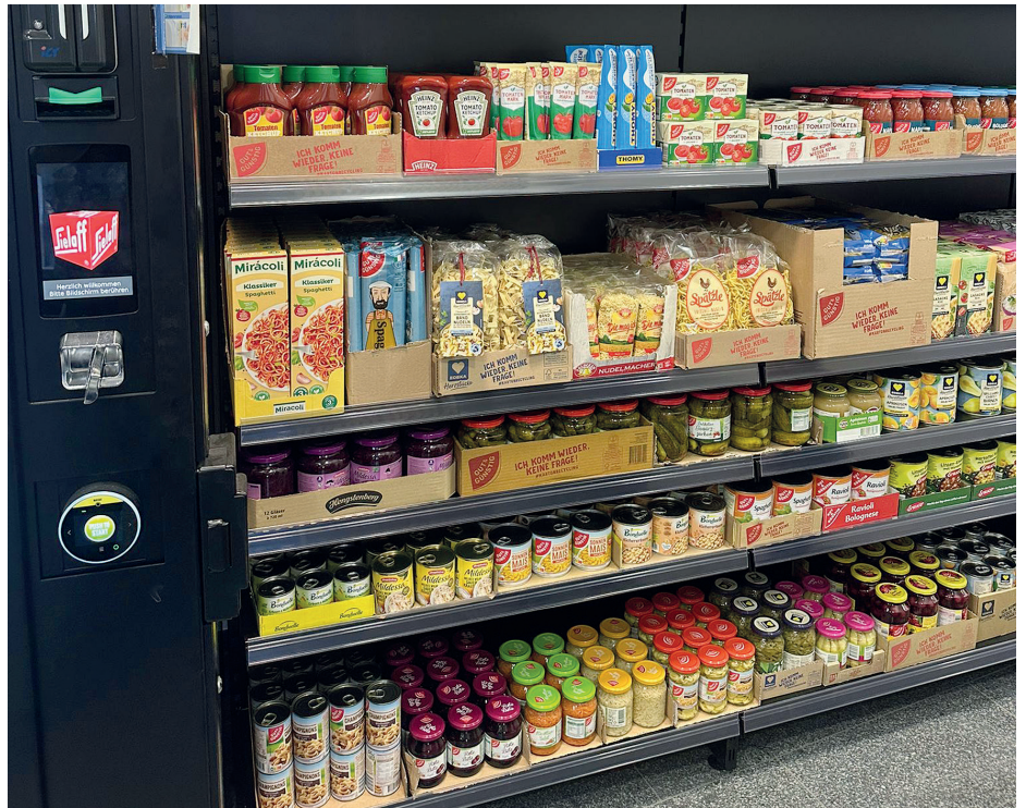
Automaten und neue Regale: Der 24/7 SB-Shop in der ehemaligen Volksbank Eichen wächst.

Auch in Heldenbergen tut sich etwas auf dem Markt der rund um die Uhr geöffneten Läden - wenn auch in kleinerem Umfang: Im Bahnhofsgebäu-