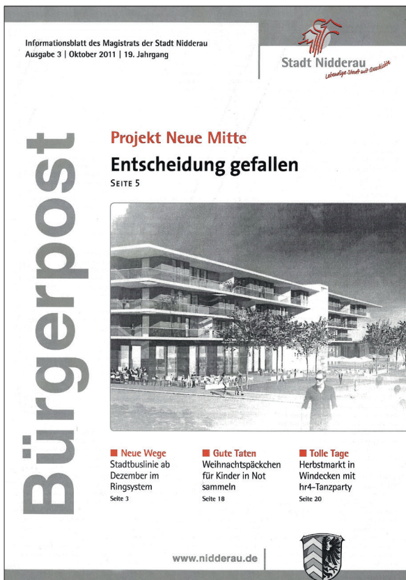
Vision 2011: „Landmark“ als Anker der Neuen Mitte.