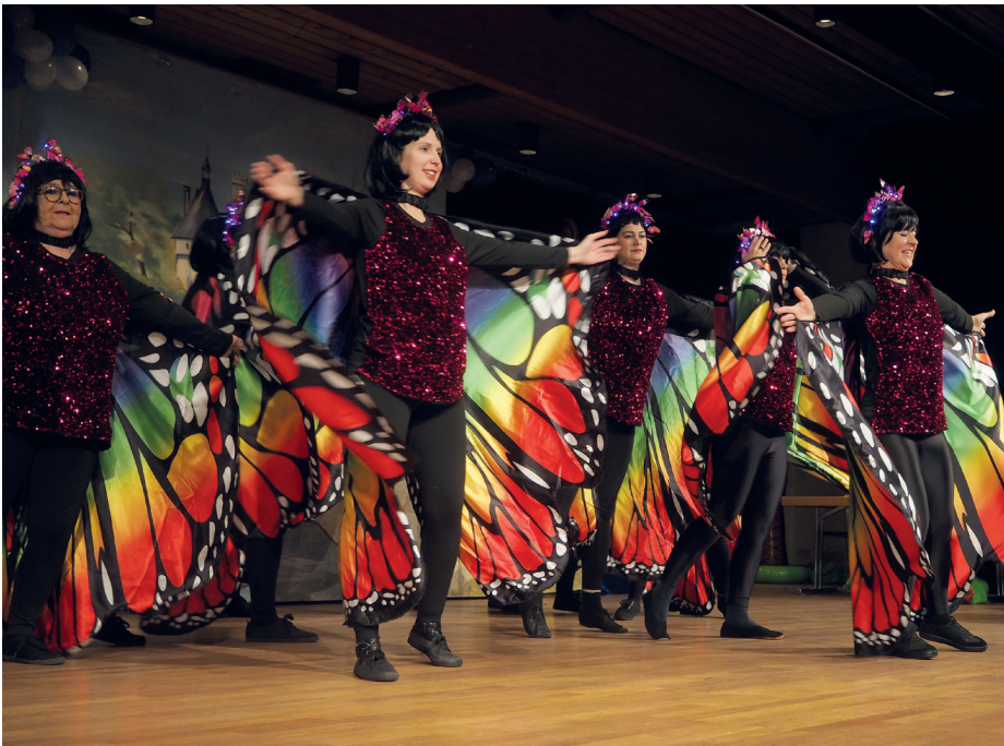
Von plumpen Raupen zu schönen Schmetterlingen: Die Showtanzgruppe Chicas beeindruckte mit ihrer tänzerischen Metamorphose.