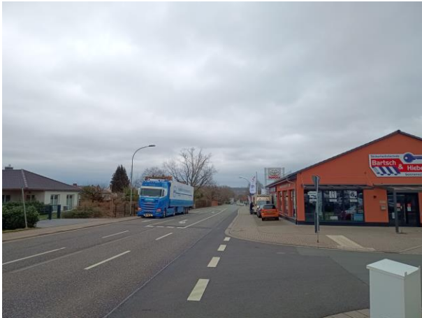
Abb. 4 Friedberger Straße Blickrichtung Osten (links) und Römerfad Blickrichtung Norden (rechts)

Das Plangebiet wird derzeit größtenteils als Ackerfläche genutzt, wobei kaum Gehölz- oder Baumbestand vorhanden ist. Dank seiner günstigen Lage und seiner Anbindung sowohl an das Gewerbegebiet als auch an die Wohngebiete, kombiniert mit den vorhandenen Infrastruktur- und Versorgungseinrichtungen, ist das Plangebiet sehr gut für die geplante Entwicklung als mischgenutzter Standort geeignet. Es wird in Zukunft die städtebauliche Funktion als Verbindungsglied zwischen Wohn- und Gewerbegebieten innehaben.