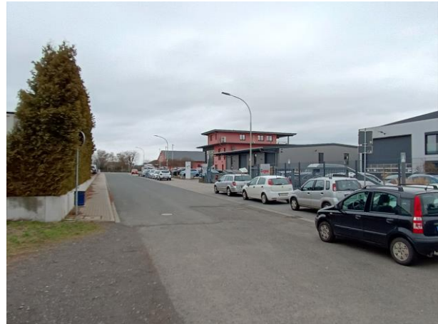
Abb. 5 Westen Erweiterung GEe 2/GEe 3 (links) und Blickrichtung Südosten Erweiterung GEe 1/ MI (rechts)