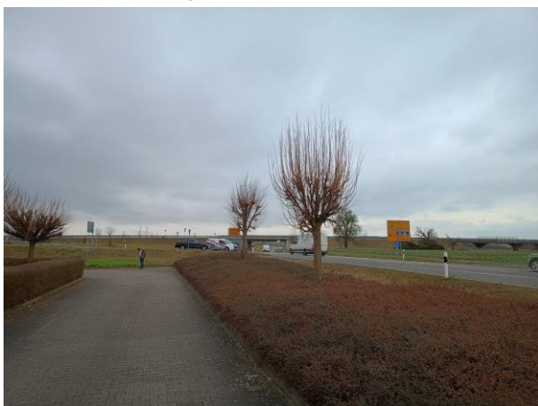
Abb. 3 Friedberger Straße Anschluss B521/B45 (links) und Blickrichtung Westen von Römerpfad (rechts)

Der Nidderauer Ortsteil Heldenbergen liegt rd. 17 km südlich der Kreisstadt Friedberg und rd. 22 km nördlich von Frankfurt am Main. Er verfügt über eine vielfältige Infrastruktur und zahlreiche Versorgungsangebote. Das Plangebiet befindet sich am nordwestlichen Siedlungsrand von Nidderau an der Friedberger Straße, die hier den Ortseingang bzw. -ausgang markiert. Über die Friedberger Straße hat das Plangebiet einen direkten Anschluss an die Bundesstraßen B521 (Richtung Frankfurt und zur Autobahn A45) und B45 (Richtung Kreisstadt Friedberg). Das Plangebiet ist über die Straße Römerpfad mit der Friedberger Straße verbunden. Zur Erschließung der Erweiterungsflächen wird der Römerpfad nach Süden ausgebaut und künftig mit dem benachbarten Fachmarktzentrum im Westen verbunden.