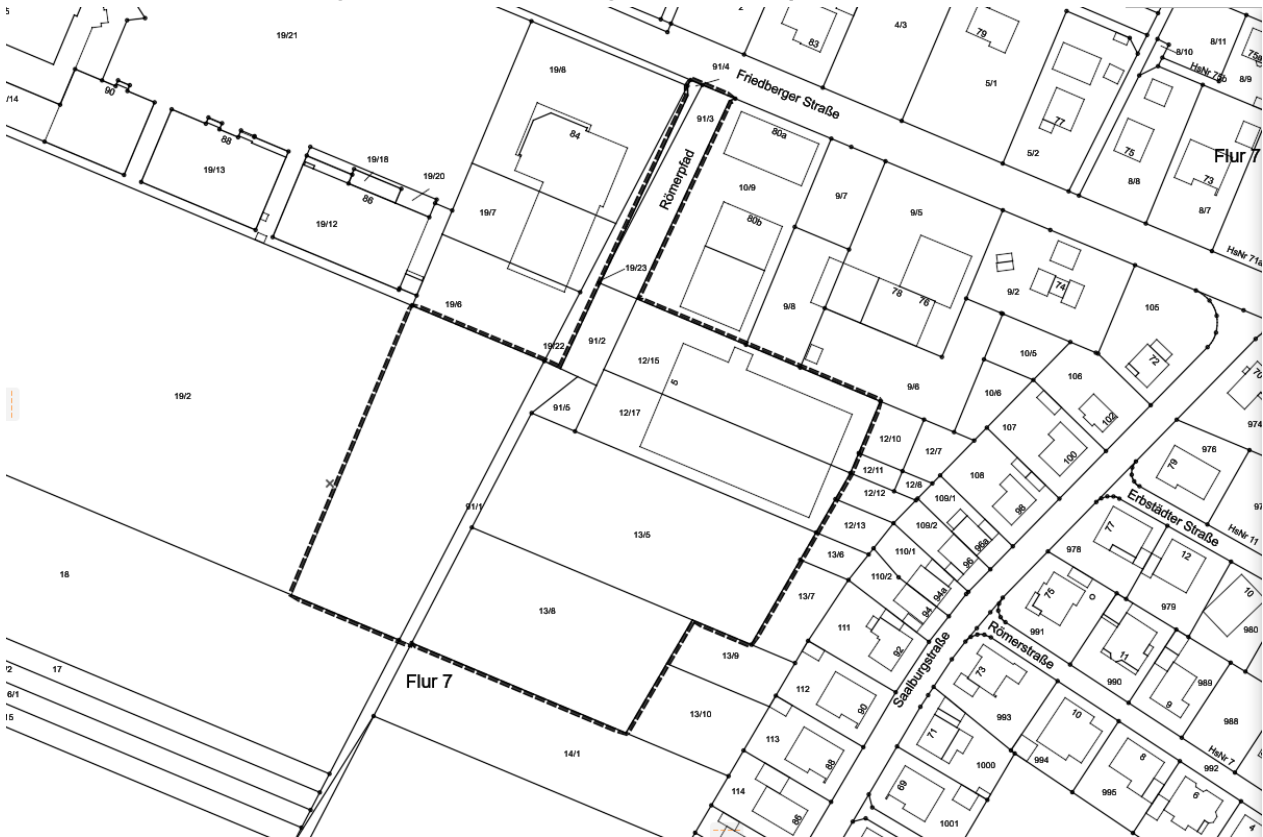
Abb. 1 Räumlicher Geltungsbereich des Bebauungsplans „Römerpfad“

Quelle: blfp planungs gmbh (2023), Kartengrundlage: Hessische Verwaltung für Bodenmanagement und Geoinformation (2023)