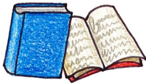
Bücher (ohne Kunstledereinbände)