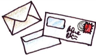
Briefumschläge (auch mit Sichtfenster)