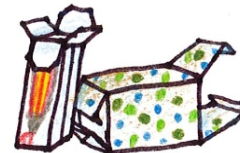
Verpackungen aus Papier oder Pappe