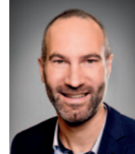
Bürgermeister Andreas Bär

Die Freude am geschriebenen Wort und die schier unendliche Vielfalt an Welten, in die uns Bücher mitnehmen – all das übt einen ganz besonderen Reiz aus.